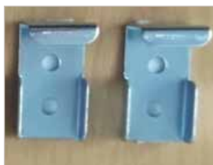
Clips de cantonnrière

Des "scratch" supplémentaire peuvent être vendus à l'unité. Leur code de commande est VC793.