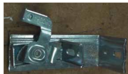
Support pivotant avec prolongation