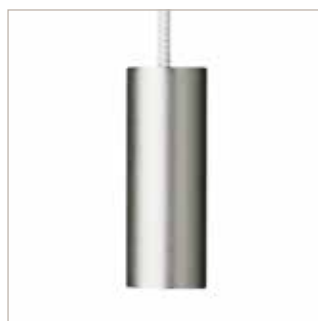
Aluminium brossé WVH-TCBA