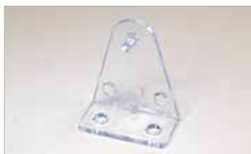
Support barre de charge

Les supports pour barre de charge sont utilisés pour fixer le bas du store sur la fenêtre ou la porte et éviter son balancement.