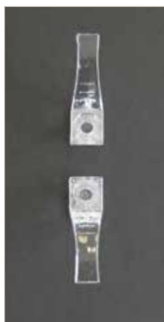
Taquet de sécurité en deux parties